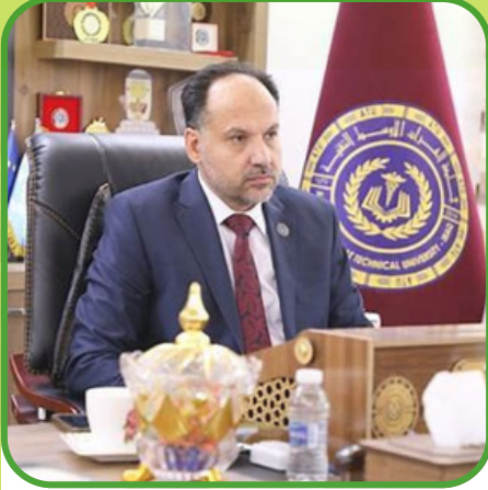
ا.د. حسن لطيف الزبيدي رئيس الجامعة

فرض الموقع الجغرافي لجامعة الفرات الاوسط التقنية عالميا مسؤولية تنمية واخلاقية تجاه المجتمعات المحلية التي تعاني من صعوبات تنمية تتعلق بارتفاع نسب الفقر وبعض اشكال الهشاشة ، وهذا ما جعل الجامعة تعزز التزامها بتحقيق اهداف التنمية المستدامة ، ربما بأكثر من غيرها من جامعات الوطن ، املا في الاسهام القوي بتحسين اوضاع الناس، والمشاركة في الحماية البيئية وتحقيق الازدهار.